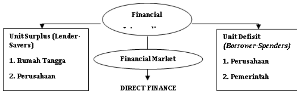
Gambar 1. Aliran dana melalui sistem keuangan syariah

Merujuk dari pada Gambar 1, tampaklah jelas bahwa keberadaan lembaga keuangan dalam ekonomi syariah sebagai aplikasi dari pada sistem ekonomi syariah adalah sangat vital karena kegiatan bisnis dan roda perekonomian suatu bangsa tidak akan berjalan tanpa adanya lembaga intermediary atau lembaga keuangan syariah. Ekonomi syariah diarahkan pada penerapan prinsip ekonomi sosial yang seragam, di mana kepentingan umat manusia menjadi prioritas utama dibandingkan dengan kepentingan individu atau pribadi ( self-interest ). Hal ini sejalan dengan kaidah fiqhiah yang menyatakan bahwa masalahat al-‘ammah (kepentingan umum) harus didahulukan daripada masalahat al-khâs (kepentingan khusus). Nilai-nilai instrumental dalam sistem ekonomi berbasis syariah meliputi zakat, larangan riba, kerjasama, dan jaminan sosial, semuanya didasarkan pada hukum dan prinsip agama Islam..