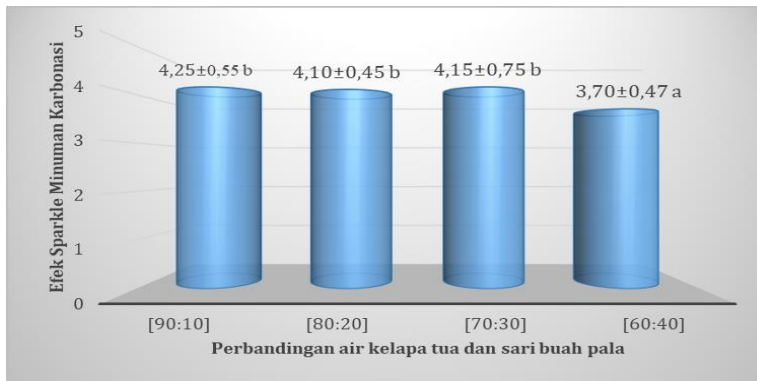
Gambar 5. Karakteristik efek sparkle minuman karbonasi air kelapa tua dengan penambahan sari buah pala

minuman karbonasi. Hasil uji organoleptik terhadap efek sparkle minuman karbonasi berkisar antara 3,70-4,25 yang secara deskriptif berkisar pada skala cukup terasa efek sparkle sampai terasa efek sparkle (Gambar 5).