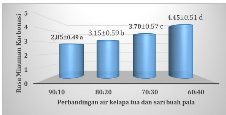
Gambar 1. Karakteristik rasa minuman karbonasi dengan perbandingan air kelapa tua dan sari buah pala

Analisis ragam menunjukkan bahwa rasio air kelapa tua dan sari buah pala yang berbeda berpengaruh nyata terhadap karakteristik rasa minuman karbonasi. Hasil uji organoleptik terhadap rasa minuman karbonasi berkisar antara 2,85-4,45 yang secara deskriptif berkisar pada skala agak berasa khas pala sampai berasa khas pala (Gambar 1).