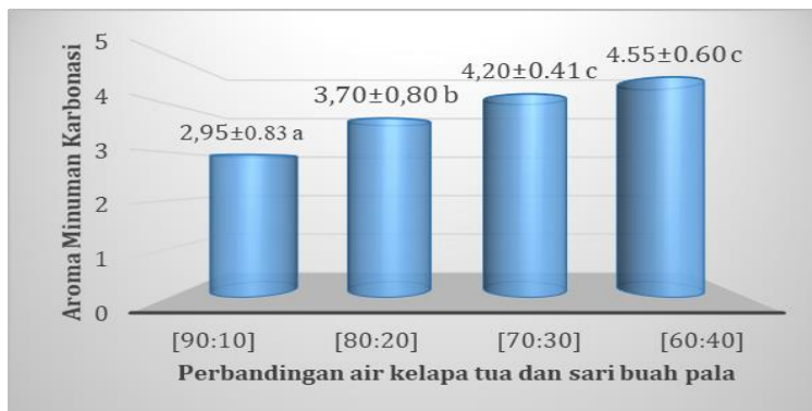
Gambar 2. Karakteristik aroma minuman karbonasi dengan perbandingan air kelapa tua dan sari buah pala

Analisis ragam menunjukkan bahwa rasio air kelapa tua dan sari buah pala yang berbeda berpengaruh nyata terhadap karakteristik aroma minuman karbonasi. Hasil uji organoleptik terhadap aroma minuman karbonasi berkisar antara 2,95-4,55 yang secara deskriptif berkisar pada skala agak beraroma khas pala sampai beraroma khas pala (Gambar 3).