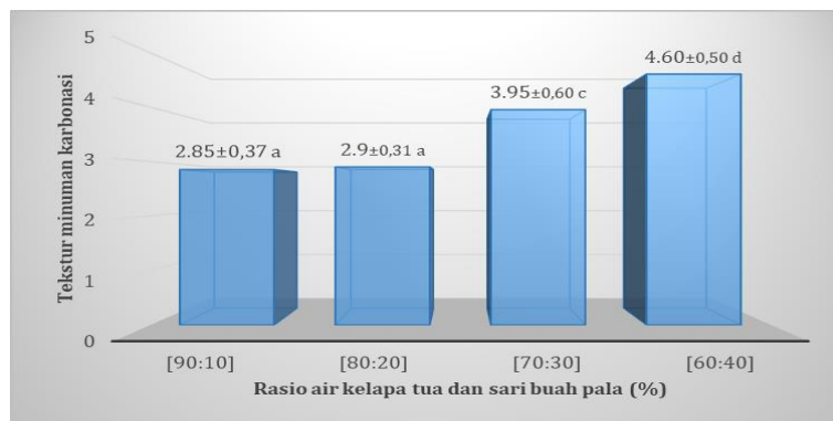
Gambar 4. Karakteristik tekstur minuman karbonasi dengan perbandingan air kelapa tua dan sari buah pala

Analisis ragam menunjukkan bahwa rasio air kelapa tua dan sari buah pala yang berbeda berpengaruh nyata terhadap karakteristik tekstur minuman karbonasi. Hasil uji organoleptik terhadap warna minuman karbonasi berkisar antara 2,85-4,60 yang secara deskriptif berkisar pada skala kurang kental sampai kental (Gambar 4).