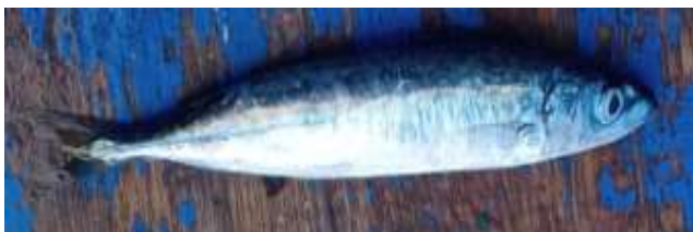
Ikan layang ( Decapterus russelli )