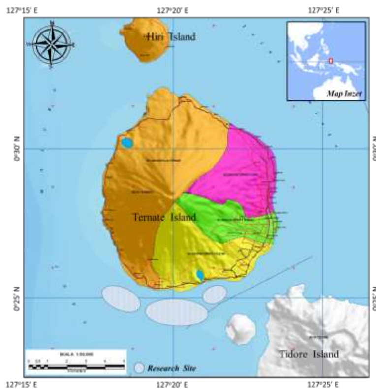
Gambar 1. Daerah penangkapan

Jenis hasil tangkapan selama pelaksanaan penelitian adalah jenis ikan pealgis kecil diantaranya ikan layang, ikan tongkol, ikan selar (Gambar 2). Penanganan hasil tangkapan merupakan tugas yang harus diselesaikan dengan cepat oleh seluruh anak buah kapal setelah selesai melakukan hauling hasil tangkapan tersebut dinaikan keatas kapal kemudian dilakukan penyortiran dan penyiraman, setelah itu dimasukkan kedalam bokor atau (baskom) menurut jenis dan ukurannya masing-masing.