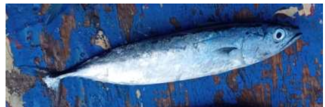
Ikan Tongkol ( Auxis thazard )