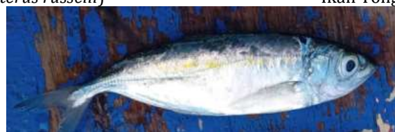
Ikan Selar ( Selaroides spp.)