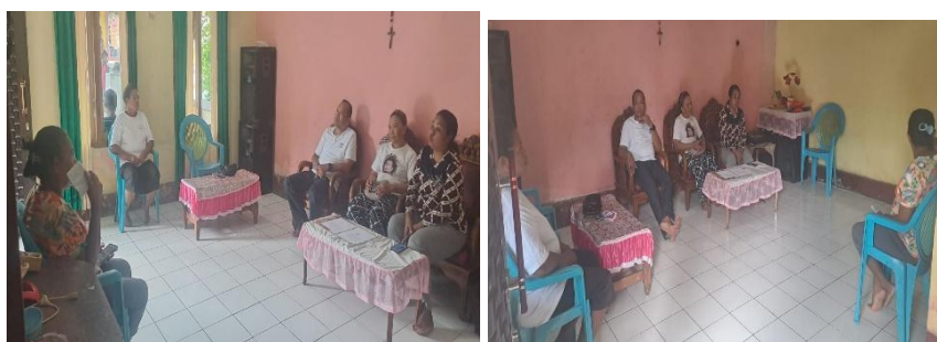
Gambar 1. Suasana Penyuluhan analisis Usaha

berpotensi menghambat peningkatan profitabilitas dan membuat usaha abon rentan terhadap risiko stagnasi atau bahkan terhenti ketika menghadapi kendala biaya atau persaingan pasar. Oleh karena itu, diperlukan penerapan manajemen keuangan yang baik, termasuk pencatatan pendapatan dan pengeluaran, perhitungan laba, serta perencanaan anggaran. Menurut Kasmir (2019), manajemen keuangan yang terstruktur membantu pelaku usaha dalam mengendalikan biaya, mengoptimalkan laba, dan menjaga keberlangsungan usaha. Hal senada juga disampaikan oleh Riyanto (2015), bahwa pengelolaan keuangan yang tepat merupakan kunci utama untuk meningkatkan profitabilitas dan daya saing usaha.