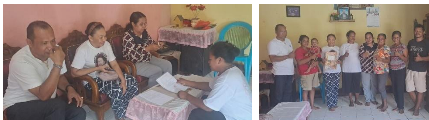
Gambar 2. Pendampingan praktik Analisis Usaha

mampu merincikan kebutuhan produksi dan mengendalikan pengeluaran. Kelompok usaha juga dilatih menghitung margin keuntungan untuk meningkatkan profitabilitas dan peluang pengembangan usaha. Selain itu, peserta diarahkan menerapkan manajemen keuangan terstruktur sehingga kelompok usaha abon ikan Crislea dapat dikelola secara efektif, berkelanjutan, dan berdampak positif bagi kesejahteraan anggota kelompok.