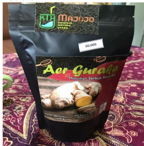
Gambar 2. Produk Air Guraka KTH Majojo

Air guraka adalah minuman tradisional khas Maluku, Indonesia, yang dikenal karena kehangatannya dan rasa manisnya yang khas. Terbuat dari campuran rempah-rempah dan bahan alami antara lain (Air, Jahe, Kayu Manis, Gula Merah dan Daun Pandan), minuman ini tidak hanya lezat, tetapi juga bermanfaat dan berhasiat bagi kesehatan, seperti mengobati batuk dan flu, menghangatkan badan serta menambah stamina, kemasan yang digunakan untuk pengemasan produk air guraka ini adalah menggunakan Standing Pouch , harga produk air guraka pada KTH Majojo adalah per Pouch nya sebesar Rp. 50.000.