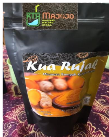
Gambar 5. Produk Kua Rujak KTH Majojo

Kuah Rujak/ Kunyit Asam adalah minuman tradisional khas Indonesia yang merupakan produk andalan pada KTH Majojo yang terbuat dari bahan-bahan alami dan rempah-rempah pilihan. Minuman ini terkenal karena rasanya yang menyegarkan. Manfaat dan khasiat dari minuman kua rujak adalah meringankan nyari hait, melancarkan, minuman adalah untuk ibu-ibu pasca melahirkan serta dapat memberikan stamina bagi tubuh. Kemasan yang digunakan untuk pengemasan produk Kua Rujak ini adalah menggunakan Standing Pouch , harga produk kua rujak pada KTH Majojo adalah per Pouch nya sebesar Rp. 50.000.