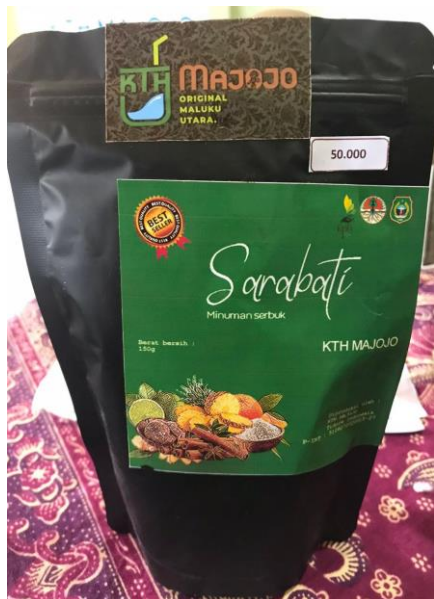
Gambar 3. Produk Sarabati KTH Majojo

Sarabati adalah minuman tradisional yang terbuat dari campuran bahan alami seperti jahe, jeruk nipis, jeruk manis, nenas, gula merah, gula pasir, pandan, dan kayu manis, manfaat dan khasiat dari minuman sarabati adalah, sebagai obat untuk batuk dan flu, dapat menghangatkan badan serta dapat memberikan stamina, kemasan yang digunakan untuk pengemasan produk sarabati ini adalah menggunakan Standing Pouch , harga produk sarabati pada KTH Majojo adalah per Pouch nya sebesar Rp. 50.000.