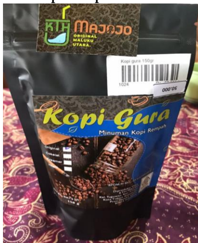
Gambar 4. Produk Kopi Rempah KTH Majojo

Kopi Gura adalah campuran kopi yang kaya rempah dengan sentuhan bahan-bahan alami seperti jahe, cengkeh, pala, kayu manis, gula, dan daun pandan. Kopi Gura menawarkan pengalaman minum kopi yang unik dengan